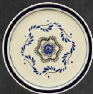
PLATO TRINCHE 27 cm (10 5/8") Código 317265