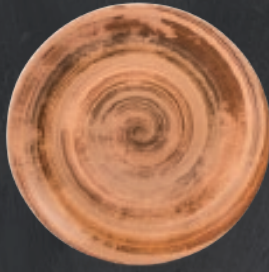
PLATO REGINA 28 cm (11") Código 322547