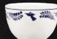
TAZA CONSOMÉ 220 mL (7.5 oz) Código 311084