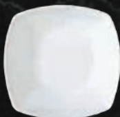
TAZÓN CEREAL 16 cm (6 2/7") 410 mL (13.8 oz) Código 301653