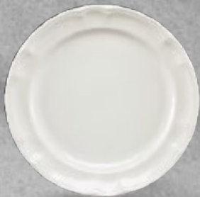
PLATO TRINCHE 27.5 cm (11") Código 3188