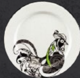
PLATO SALAD CON ALA 24 cm (9 4/9") Código 316641