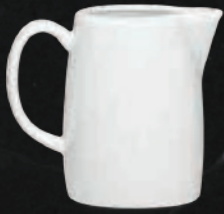
CREMERA 300 mL (10 oz) Código 301659