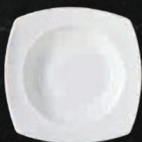
PLATO SOPERO 22 cm (8 2/3") 300 mL (10 oz) Código 301647