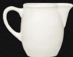
LECHERA 320 mL (11 oz) Código 312808