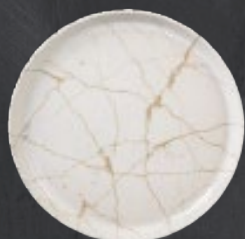
PLATO GOURMET 26 cm (10.2") Código 322610