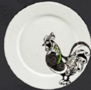
PLATO TRINCHE CON ALA 27 cm (10 5/8") Código 316640