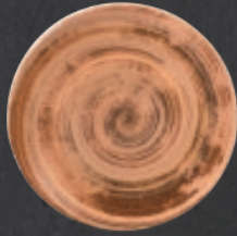
PLATO REGINA 23 cm (9") Código 322546