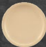
PLATO P/POSTRE 227 mL (7.7 oz) Código 35983