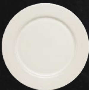
PLATO BASE 32 cm (12 3/5") Código 309052