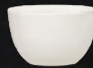
TAZA CONSOMÉ 220 mL (7.5 oz) Código 310088