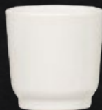
TAZA HUEVO 200 mL (7 oz) Código 312818