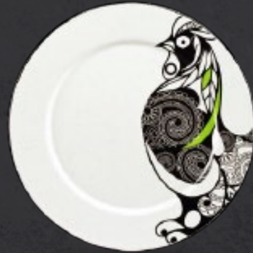
PLATO TRINCHE CON ALA 32 cm (12 3/5") Código 316639