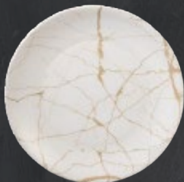
PLATO REGINA 28 cm (11") Código 322611