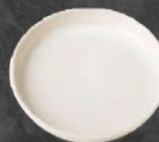
PLATO GOURMET 18 cm (7") Código 321666