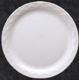
PLATO TRINCHE 27 cm (10 5/8") Código 3746