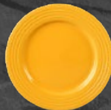
PLATO PASTEL 21 cm (8 1/4") Código 320821