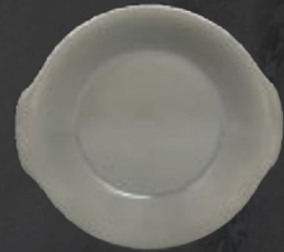
PLATO CACEROLA 23 cm (9") Código 322614