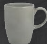
TARRO 310 mL (10.5 oz) Código 322659