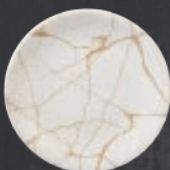
PLATO REGINA 19 cm (7.5") Código 322613