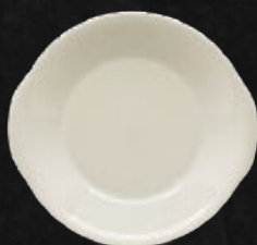
PLATO CACEROLA 23 cm (9") Código 309045