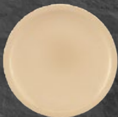
PLATO TRINCHE 25 cm (9 5/6") Código 35987 23 cm (9") Código 35989