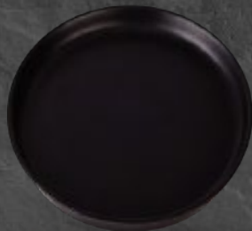
PLATO GOURMET 26 cm (10,2") Código 321657