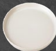
PLATO GOURMET 20 cm (7,9") Código 321660