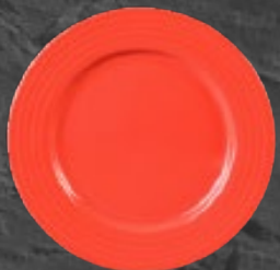
PLATO TRINCHE 26 cm (10 1/4") Código 320815