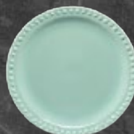
PLATO PASTEL 19 cm (7 1/2") Código 317223