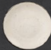
PLATO REGINA 19 cm (7.5") Código 322617