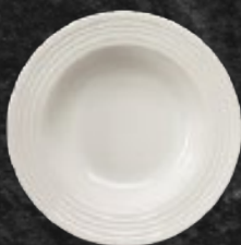
PLATO SOPERO 400 mL (13.5 oz) Código 314770