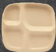
CHAROLA C/DIVISIÓN 28 cm (11") Código 35995