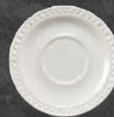
PLATO P/TAZA 16 cm (6 2/7") Código 317069