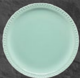
PLATO TRINCHE 27 cm (10 5/8") Código 317221