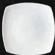
PLATO PASTEL 20 cm (8") Código 316197