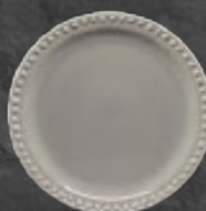
PLATO PASTEL 19 cm (7 1/2") Código 317213