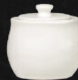
AZUCARERA C/TAPA 200 mL (7 oz) Código 312806