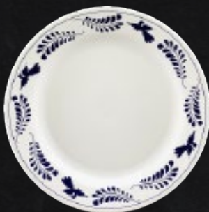
PLATO BASE 32 cm (12 3/5") Código 309645