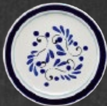
PLATO PASTEL 19 cm (7 7/8") Código 317277