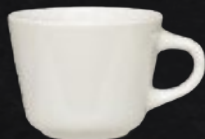
TAZA SANTA ANITA 210 mL (7 oz) Código 312812