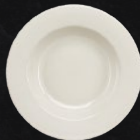
PLATO PASTA BOWL 31 cm (12 1/5") Código 310089