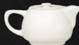
TETERA 290 mL (10 oz) Código 312811