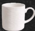
TARRO 340 mL (11.4 oz) Código 321926