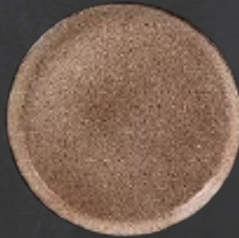
PLATO GOURMET 26 cm (10.2") Código 322624