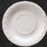
PLATO P/TAZA 16 cm (6 2/7") Código 3740