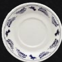
PLATO EMBROCABLE 12.5 cm (5") Código 309658