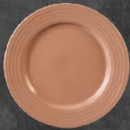
PLATO TRINCHE 26 cm (10 1/4") Código 320809