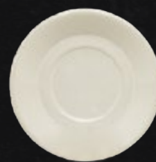
PLATO CAFÉ 16 cm (6 2/7") Código 309049