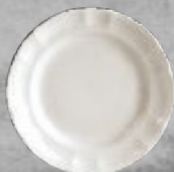
PLATO PANERO 16 cm (6 2/7") Código 320563