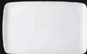
PLATO RECTANGULAR 35 cm (13 7/9") Código 301651 32 cm (12 3/5") Código 301650 25 cm (9 5/6") Código 301654