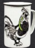
TARRO CERVECERO 620 mL (21 oz) Código 316642