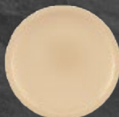
PLATO POSTRE 192 mL (6.5 oz) Código 36139