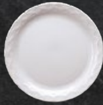
PLATO PASTEL 20 cm (7 7/8") Código 3738