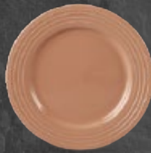
PLATO PASTEL 21 cm (8 1/4") Código 320808