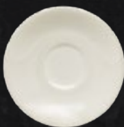
PLATO MOKA 12 cm (4 5/7") Código 309050