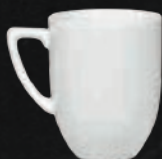
TARRO CAPUCHINO 300 mL (10 oz) Código 301661