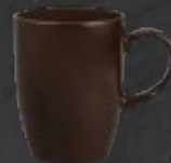
TARRO 310 mL (10.5 oz) Código 322625