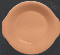
PLATO CACEROLA 23 cm (9") Código 322579