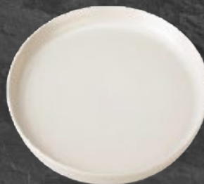
PLATO GOURMET 26 cm (10,2") Código 321658

La colección idónea para la cocina creativa. Reinventando la forma de presentar cada platillo.