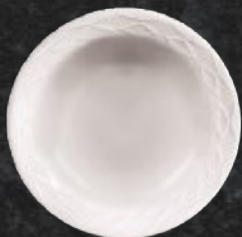
PLATO SOPERO 380 mL (12.8 oz) Código 321923