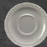
PLATO P/TAZA 16 cm (6 2/7") Código 317214