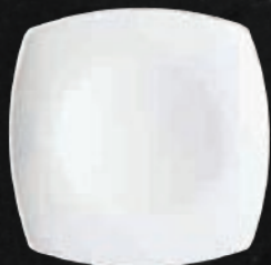
PLATO BASE 29.5 cm (11.6") Código 301652