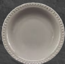
PLATO SOPERO 700 mL (24 oz) Código 317212