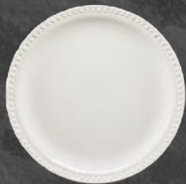
PLATO TRINCHE 27 cm (10 5/8") Código 317066