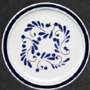
PLATO TRINCHE 27 cm (10 5/8") Código 317275