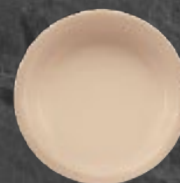
PLATO P/CEREAL 396 mL (13.4oz) Código 35985