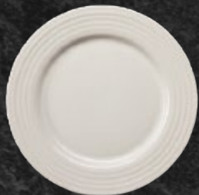
PLATO TRINCHE 26 cm (10 1/4") Código 314769