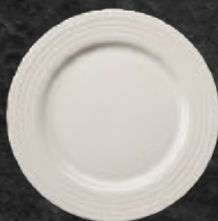
PLATO PASTEL 21cm (8 1/4") Código 314771