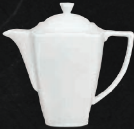
TETERA 1.7 L (35.1 oz) Código 301660