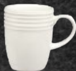
TARRO 310 mL (10.9 oz) Código 319433