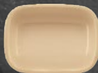
PLATÓN CUADRILONGO 25 cm (10") Código 35994