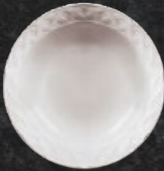
PLATO SOPERO 480 mL (16.2 oz) Código 3765