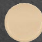
PLATO P/TAZA 13.7 cm (5.4") Código 35990