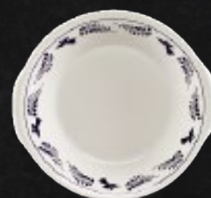
PLATO CACEROLA 23 cm (9") Código 309646