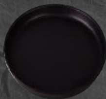
PLATO GOURMET 20 cm (7,9") Código 321659