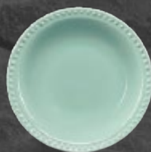
PLATO SOPERO 700 mL (24 oz) Código 317222