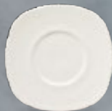
PLATO P/TAZA 15 cm (6") Código 308192