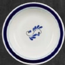
PLATO SOPERO 700 mL (24 oz) Código 317276