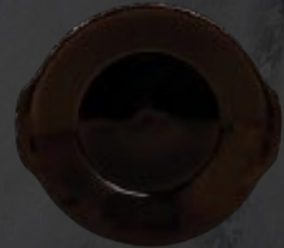
PLATO CACEROLA 23 cm (9") Código 322631