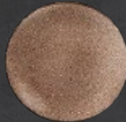
PLATO REGINA 19 cm (7.5") Código 322620