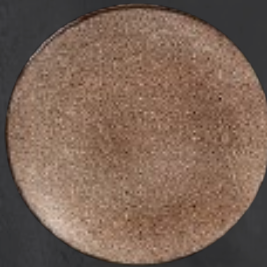
PLATO REGINA 28 cm (11") Código 322622