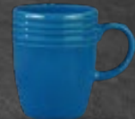
TARRO 310 mL (10.9 oz) Código 320811