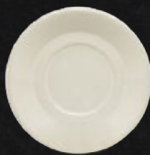
PLATO EMBROCABLE 15 cm (6") Código 309051