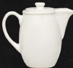
CAFETERA 540 mL (19 oz) Código 312807