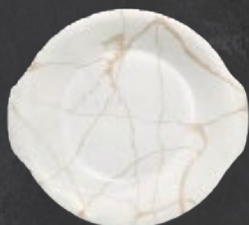
PLATO CACEROLA 23 cm (9") Código 322609