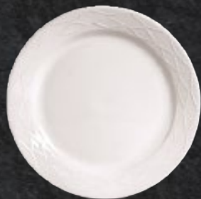
PLATO TRINCHE 27 cm (10 5/8") Código 321922