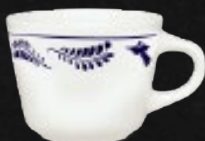
TAZA SANTA ANITA 210 mL (7 oz) Código 309653