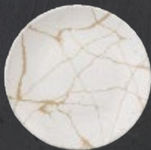
PLATO REGINA 23 cm (9") Código 322612