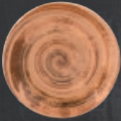
PLATO REGINA 19 cm (7.5") Código 322545