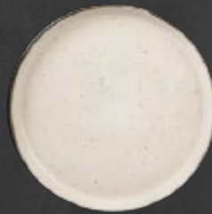
PLATO GOURMET 26 cm (10.2") Código 322616