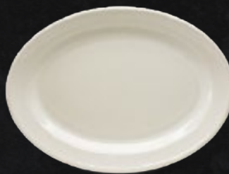
PLATO OVALADO 33 cm (13") Código 309047 27 cm (10 5/8") Código 309048