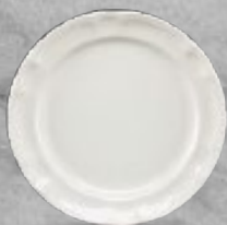
PLATO PASTEL 20 cm (7 7/8") Código 3167