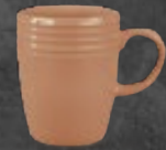
TARRO 310 mL (10.9 oz) Código 320810