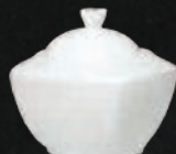
AZUCARERA 250 mL (8.5 oz) Código 301658