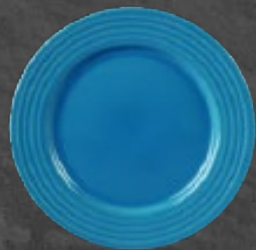
PLATO TRINCHE 26 cm (10 1/4") Código 320812