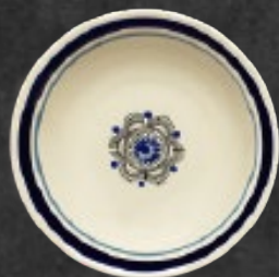
PLATO SOPERO 700 mL (24 oz) Código 317266