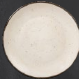
PLATO REGINA 28 cm (11") Código 322619