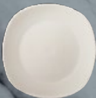
PLATO PASTEL 19 cm (7 1/2") Código 308191