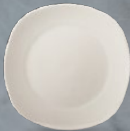
PLATO TRINCHE 25 cm (9 5/6") Código 308189