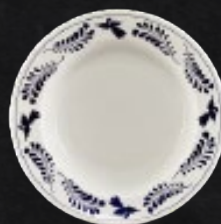
PLATO SOPERO 23 cm (9") 300 mL (10 oz) Código 309663