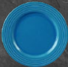
PLATO PASTEL 21 cm (8 1/4") Código 320814