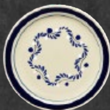
PLATO PASTEL 19 cm (7 7/8") Código 317267