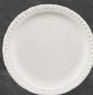
PLATO PASTEL 19 cm (7 1/2") Código 317068