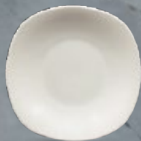
PLATO SOPERO 610 mL (21 oz) Código 308190