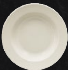
PLATO SOPERO 23 cm (9") 300 mL (10 oz) Código 309044