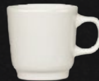
TAZA MUG 290 mL (10 oz) Código 309054