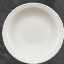
PLATO SOPERO 700 mL (24 oz) Código 317067