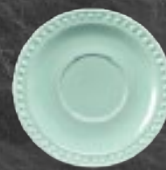
PLATO P/TAZA 16 cm (6 2/7") Código 317224