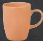
TARRO 310 mL (10.5 oz) Código 322558