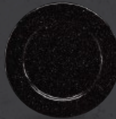
PLATO TRINCHE CON ALA