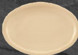
PLATÓN TAMPIQUEÑO 33 cm (13") Código 35991 29 cm (11 3/7") Código 35988