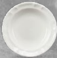
PLATO SOPERO 390 mL (13.5 oz) Código 3234