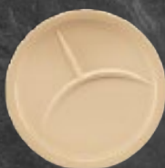
PLATO TRINCHE C/DIVISIÓN 28 cm (11") Código 35997