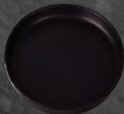
PLATO GOURMET 24 cm (9,4") Código 321663