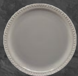
PLATO TRINCHE 27 cm (10 5/8") Código 317211