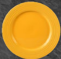
PLATO TRINCHE 26 cm (10 1/4") Código 320819