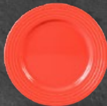
PLATO PASTEL 21 cm (8 1/4") Código 320816