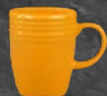
TARRO 310 mL (10.9 oz) Código 320822