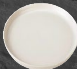
PLATO GOURMET 24 cm (9,4") Código 321665