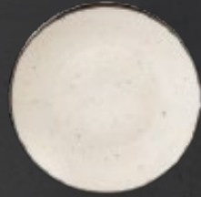
PLATO REGINA 23 cm (9") Código 322618