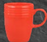
TARRO 310 mL (10.9 oz) Código 320818