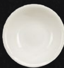
PLATO COMPOTA 230 mL (8 oz) Código 309046