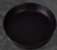
PLATO GOURMET 18 cm (7") Código 321664