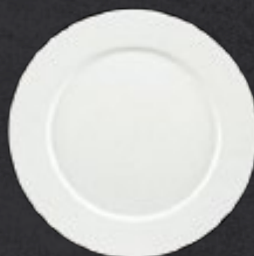
PLATO TRINCHE CON ALA