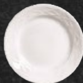
PLATO PANERO 16 cm (6 2/7") Código 321925