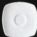
PLATO CAFÉ 14 cm (5 1/2") Código 313749