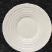
PLATO P/TAZA 16 cm (6 2/7") Código 314772