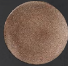
PLATO REGINA 23 cm (9") Código 322621